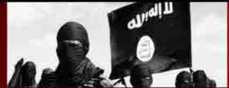
الشيخ أبو المنذر الشنقيطي